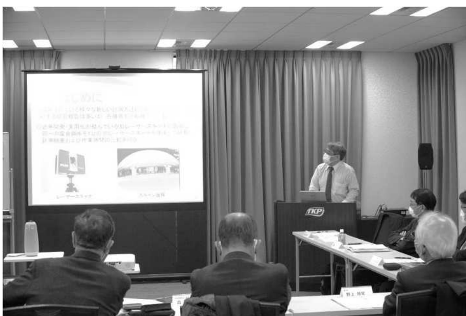
写真：令和3年度第1回技術委員会及び第35回研究成果発表会より