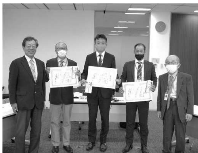
写真：令和3年度定期総会より